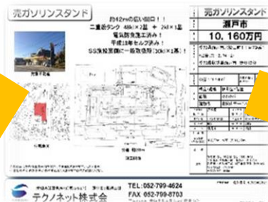
ガソリンスタンド新設工事