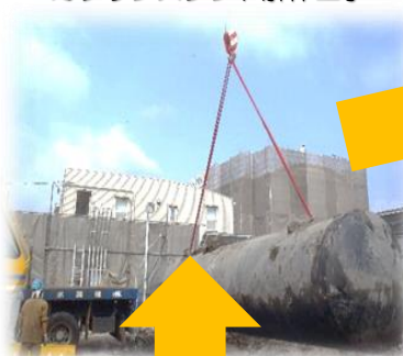
ガソリンスタンド解体工事